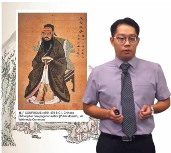
孔子 CONFUCIUS (c551-479 B.C.), Chinese philosopher. See page for author [Public domain], via Wikimedia Commons